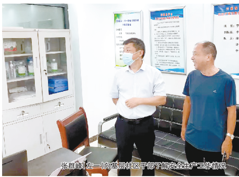
张群峰(左一)向基层社区干部了解安全生产工作情况

本报讯(记者王凯文/图)8月23日市应急管理局党委委员、三级调研员张群峰带领业务科室骨干人员和专家到经济开发区开展“局长走基层”调研服务活动。调研组先后深入经济开发区安监办、太昊路街道办事处、中国石化周口油库、中食(周口)冷藏物流有限公司、太昊路街道办许寨社区全面了解安全生产、防灾减灾、防汛抗旱、物资储备、宣传培训等方面工作开展情况。