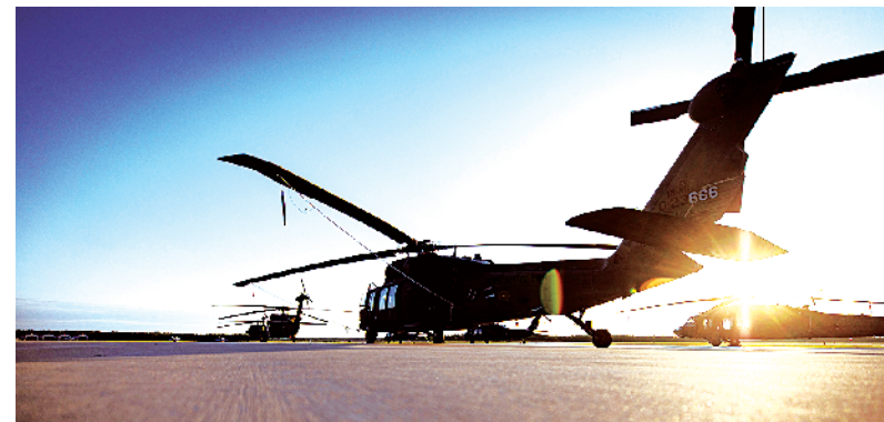
这张2019年7月24日拍摄的照片显示,美国田纳西州国民警卫队的“黑鹰”直升机停在停机坪上。

新华社华盛顿2月15日电(记者 孙丁)美国一架军用直升机15日在亚拉巴马州坠毁,机上2人全部丧生。据亚拉巴马州执法部门通报,坠机地点位于该州北部麦迪逊县一条高速公路旁,在亚拉巴马州和田纳西州交界附近。