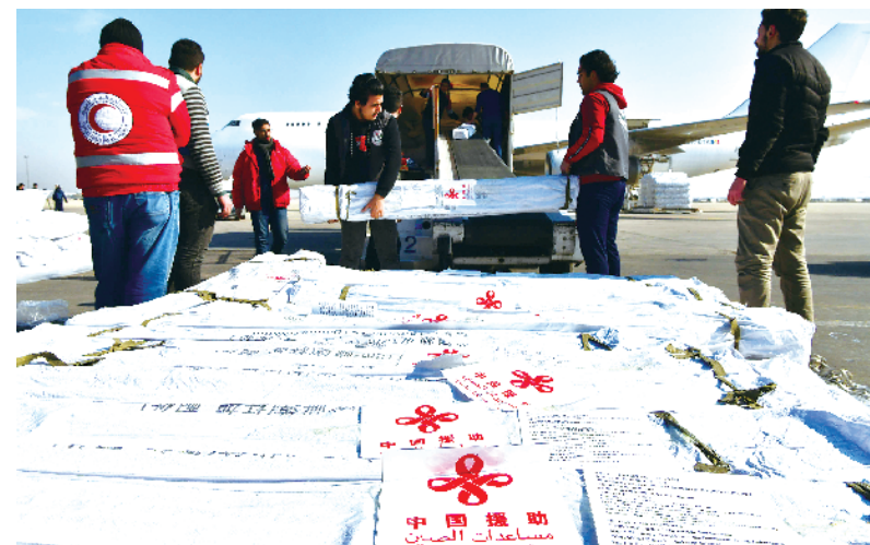
2月15日,工作人员在叙利亚大马士革国际机场卸载中国政府援助的人道主义物资。

新华社北京2月16日电 综合新华社驻外记者报道,中国政府援助叙利亚抗震救灾人道主义物资15日运抵叙首都大马士革。据土耳其和叙利亚政府及救援机构消息,土耳其南部靠近叙利亚边境地区的强震已致两国超过4.1万人遇难。