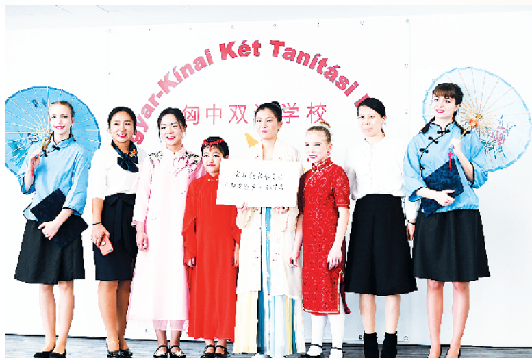
2月24日，在匈牙利首都布达佩斯的匈中双语学校，师生们在复信转交仪式后手持“努力做传承发展中匈友好事业的使者”的标语合影。