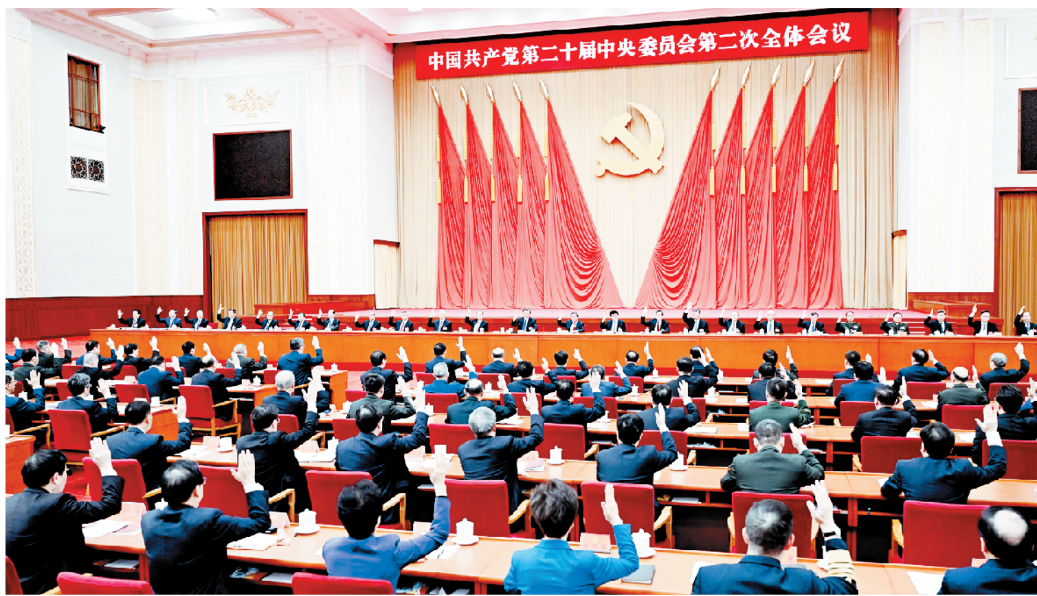
中国共产党第二十届中央委员会第二次全体会议,于2023年2月26日至28日在北京举行。中央政治局主持会议。