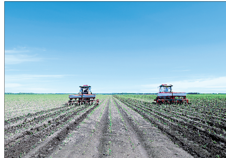
“大粮仓”黑龙江进入大田夏管关键时期

6月26日通过视频会议形式听取具体意见。如果两个推荐举办地满足所有要求,最终决定将于7月22日至24日在巴黎举行的国际奥委会第142次全会上公布。