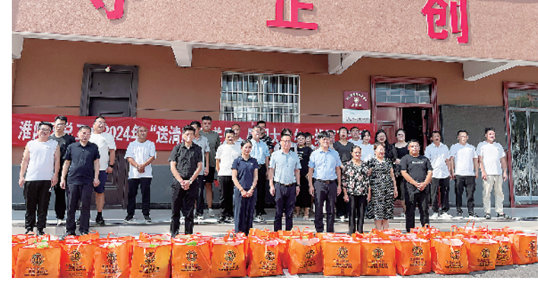
区总工会慰问乡镇一线职工。

区总工会送去的不仅有简单的物资,还有对全区乡镇职工的关爱,切实增强了广大乡镇职工的幸福感和获得感,希望全区广大乡镇职工继续在基层一线挥洒汗水,用双手托起乡村振兴梦想,用行动获得群众认可,为谱写新时代乡村振兴新篇章、加快建设“七个新淮阳”作出新的更大贡献。