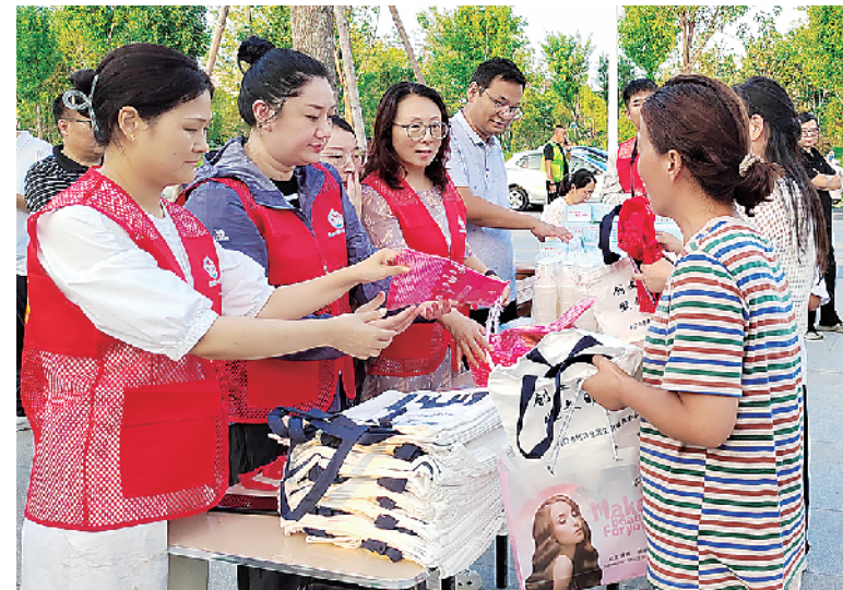
“垃圾分类达人”和志愿者向市民发放垃圾分类宣传品。

抓项目、农业强市“七个专项行动”强基础,紧紧抓住“经济运行”这个着力点、紧紧抓住“项目建设”这个支撑点、紧紧抓住“产业发展”这个突破点、紧紧抓住“农业农村”这个落脚点、紧紧抓住“城市建管”这个切入点、紧紧抓住“民生福祉”这个出发点、紧紧抓住“社会治理”这个着眼点、紧紧抓住“党的建设”这个根本点,努力把党的二十届三中全会精神和省委十一届七次全会精神落在行动上。