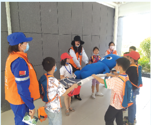
小记者观看毛毯秒变成一副担架