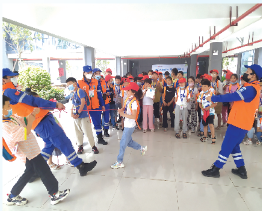
小记者模拟施救溺水者，双手拉绳，身体后仰