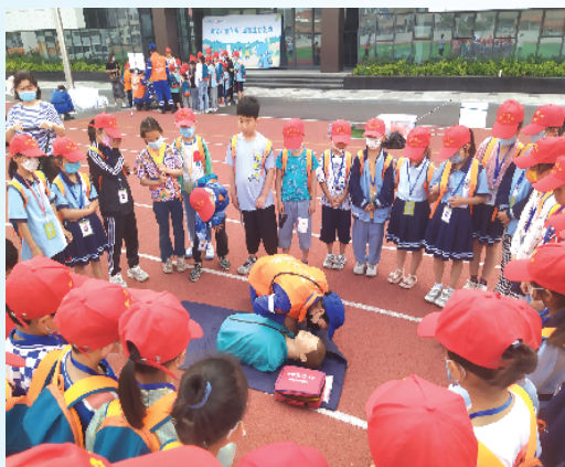
小记者观摩救援队员对模拟人进行人工呼吸

6月1日，周口报业小记者中心协同川汇蓝天救援队走进周口金海中学小学部、周口七一路第一小学，继续开展“生命教育‘救’在身边”小记者学习自救互救本领活动。