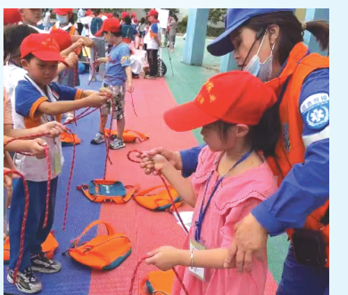
小记者在进行绳结大比拼，学习自救新技能