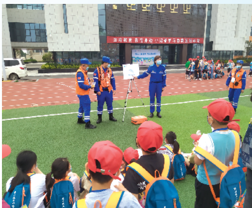
小记者听救援队员讲解海姆立克急救法要领