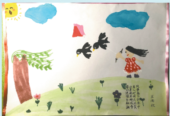
小记者:王雨欣 证号:222378 周口市文昌小学一(3)班