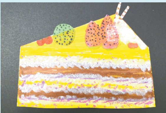
小记者:常雨莹 证号:220520 周口实验小学二(2)班