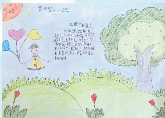
小记者:贺沐橙 证号:220029 周口莲花路小学二(2)班 (辅导老师:李倩)