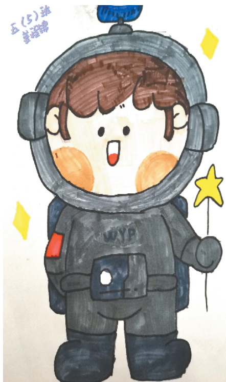
小记者:姜程锦 证号:222189 周口中原路小学五(5)班