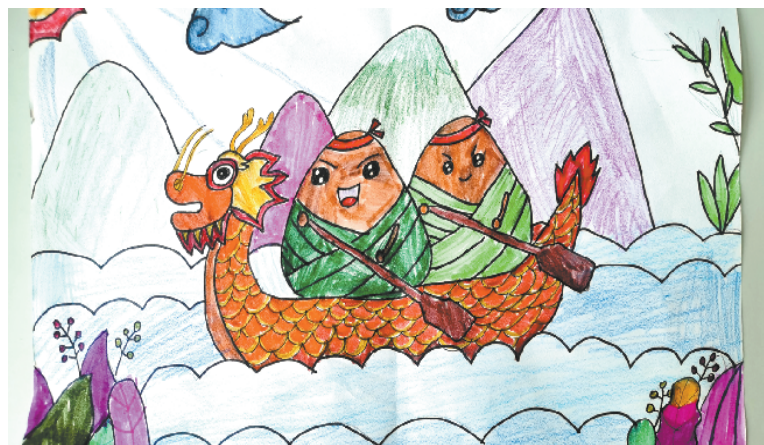
小记者:付佳音 证号:222181 周口中原路小学四(5)班