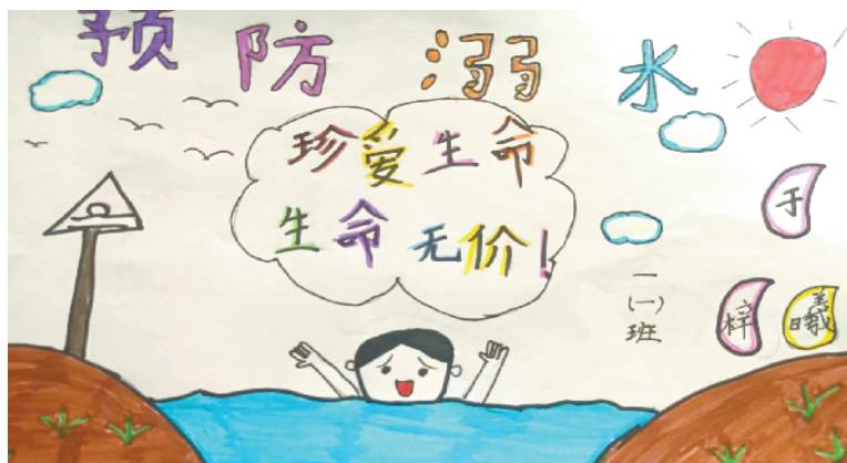
小记者:于梓曦 证号:221907 周口中原路小学一(1)班 (辅导老师:李胜男)