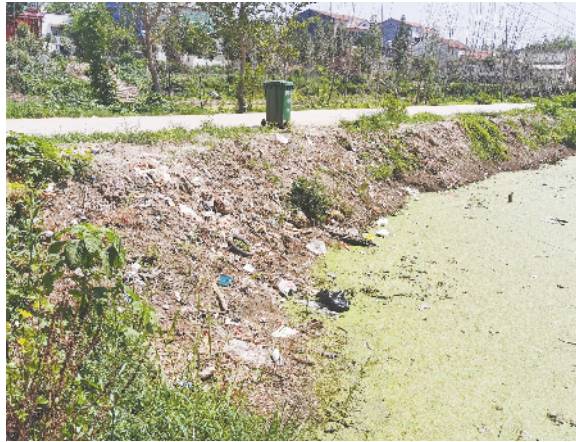
扶沟县固城乡古北村村内3个沟渠内水质变色,沟内有大量生活垃圾,白色垃圾