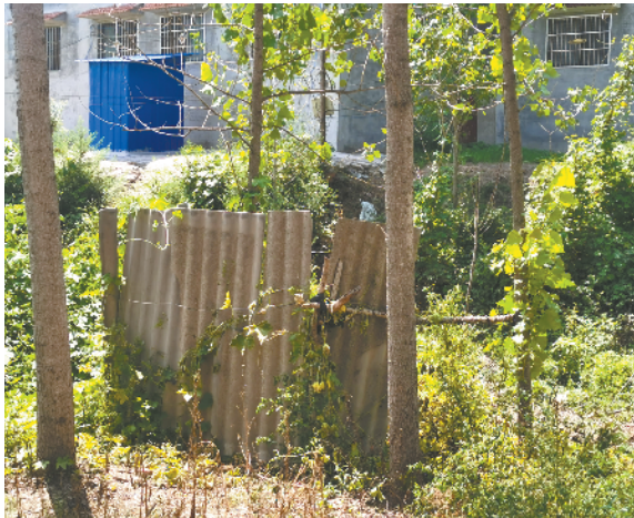
扶沟县固城乡古北村村内有多处户外简易旱厕