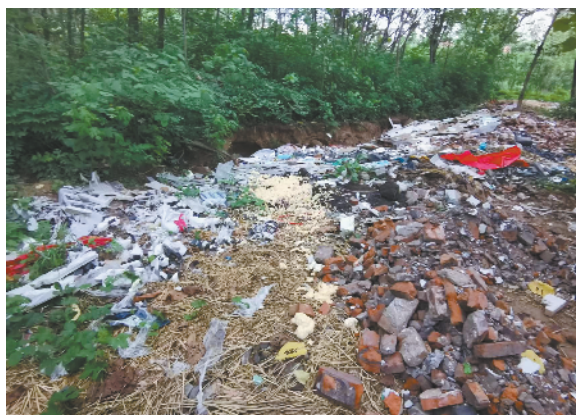
鹿邑县卫真办事处大李行政村南头有一处垃圾坑,有大量生活垃圾、秸秆和建筑垃圾