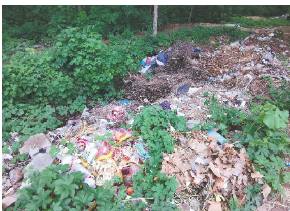
鹿邑县卫真办事处郭庄村村内和村头有生活垃圾堆放现象