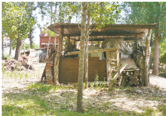
扶沟县固城乡枣林村村东路北树林中有处私搭乱建