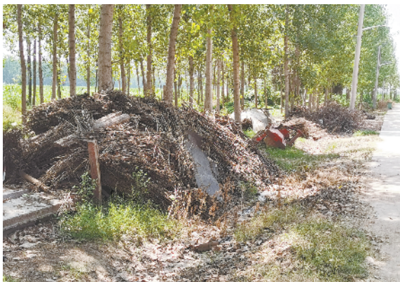
扶沟县固城乡枣林村村东路边堆积多处秸秆、废弃物