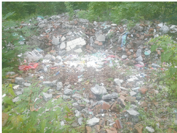
鹿邑县鸣鹿办事处黄盆窑村村口东侧道路边有建筑垃圾堆积、生活垃圾散落