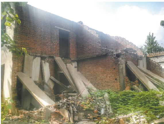
鹿邑县鸣鹿办事处王大挂村村内有一处残垣断壁有碍观瞻