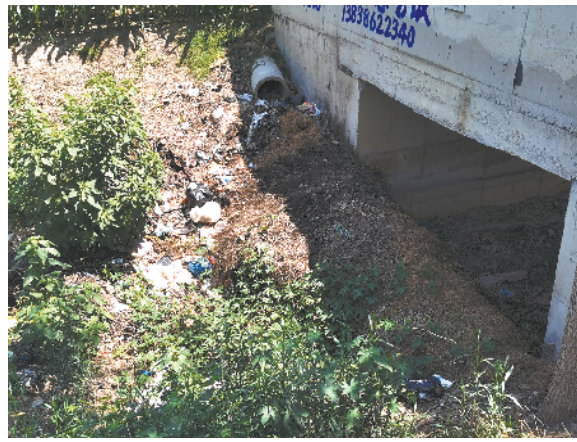
扶沟县固城乡国道230路北,古城村西沟内倾倒有生活垃圾、秸秆