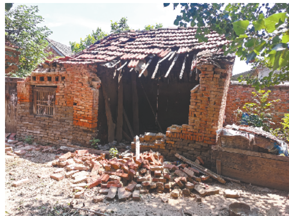
扶沟县固城乡枣林村村内有处残垣断壁