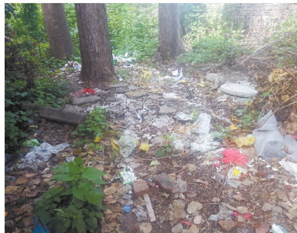
鹿邑县鸣鹿办事处赵楼村村内多处垃圾散落